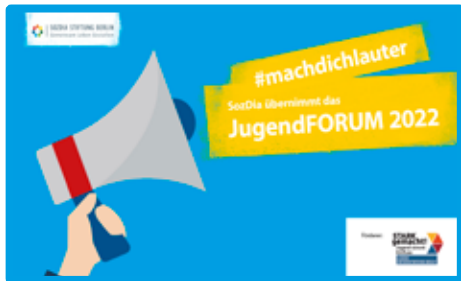
Grafik: Stephan Boehme

Wir freuen uns sehr, dass wir das JugendFORUM 2022 ausrichten werden! Das Berliner JugendFORUM versteht sich als eine neutrale Plattform für politische Diskussionen zwischen Jugendlichen und Politiker*innen. Es bietet allen Berliner Jugendlichen die Möglichkeit des aktiven Mitwirkens und -gestaltens bei ihren gesellschaftlichen und politischen Themen. Lasst uns gemeinsam „laut machen“, was junge Menschen in Berlin bewegt! Gefördert wird das Projekt durch die Senatsverwaltung für Bildung, Jugend und Familie – STARK gemacht! Jugend-Demokratiefonds Berlin, dem Landesprogramm zur Stärkung der Partizipation und des demokratischen Handelns von Kindern und Jugendlichen ( www.stark-gemacht.de ).