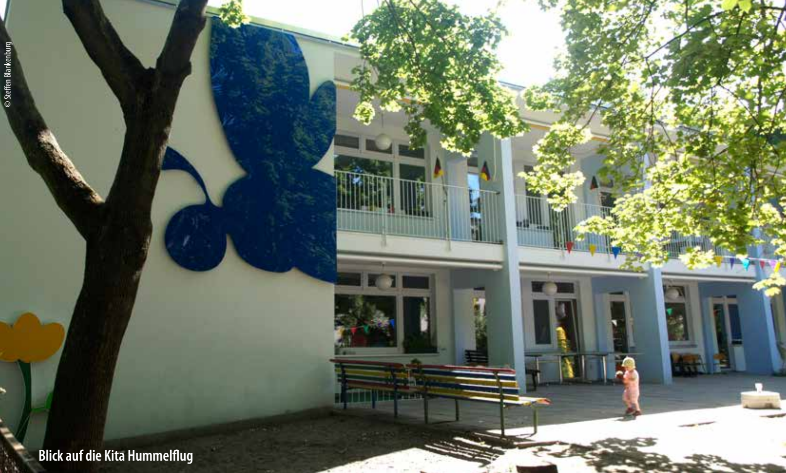
Blick auf die Kita Hummelflug